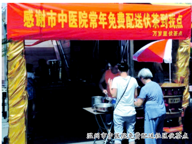
温州市中医院免费送社区伏茶点

李象坤（1612—1689），字宁侯，号菊庵，亦作鞠庵，别署迂庵，花村竺民，乐清芙蓉人。明中丞光春次子。随父迁居郡城（今温州城区）。清康熙岁贡。好古嗜学，恂恂有古儒士风。工