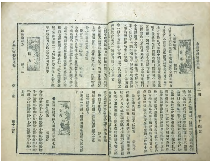
1922年《永嘉中医医药周报》刊载的《又治喘验案》

2016年中秋,是日凌晨,第14号台风“莫兰蒂”掠过台湾南部,在福建厦门沿海登陆。受“莫兰蒂”影响,中午,温州各地暴雨肆虐,泰顺县境内三座国宝级古廊桥,薛宅桥、文兴桥、文重桥被洪水冲毁。“莫兰蒂”英文名 Meranti,名字源于马来西亚的一种树。“树”来了,给台湾及闽浙各省带来了风雨灾害,愿沿途灾区众生安好!